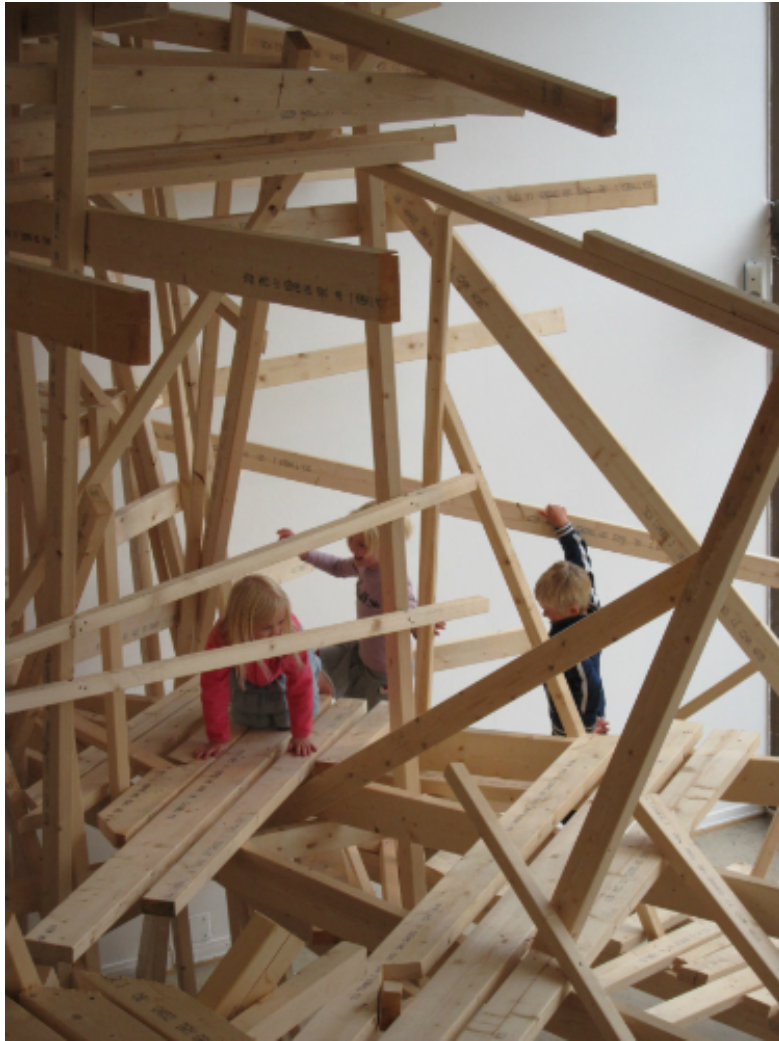
To tom fir tom, en installasjon av Ståle Sørensen man kunne klatre i.

I løpet av høsten leverte TSSK to søknader til DKS (kommune + fylkene) for skoleåret 2013/14 med to tilbud utviklet i samarbeid med to kunstnere som er programmert på TSSK i 2013. Også i budsjettsøknader til fylkene og kommunen ble det fremhevet ønske om og behov for å arbeide mer mot DKS gjennom konkrete forslag på tiltak.