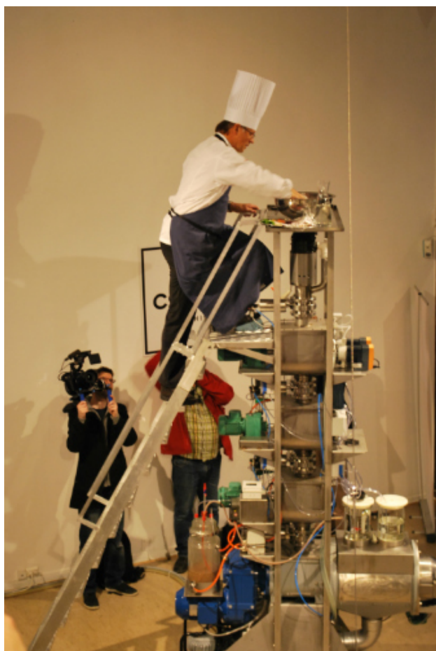
Cloaca fikk et gourmetmåltid under åpningen.

Med undertittelen, A Matter of Feeling , presenterte Meta.Morf 2012 flere banebrytende kunst- og forskningsprosjekter basert på fascinasjon og forståelse for både teknologiske og naturlig baserte livsformer. For å formidle sine prosjekter kom over 60 internasjonalt anerkjente samtidskunstnere, arkitekter, designere, musikere, forfattere og forskere fra 20 nasjoner.