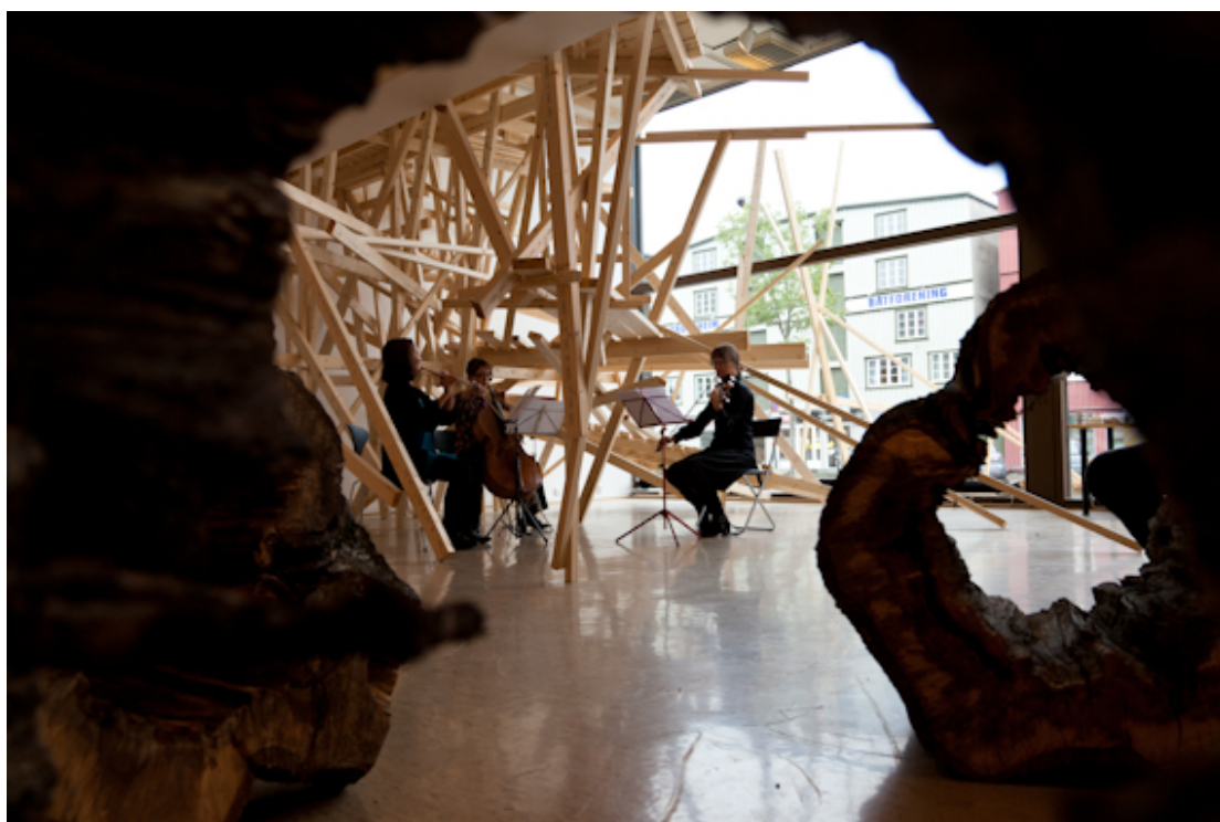
Trondheim Sinfonietta i utstillingen Tre og Trær