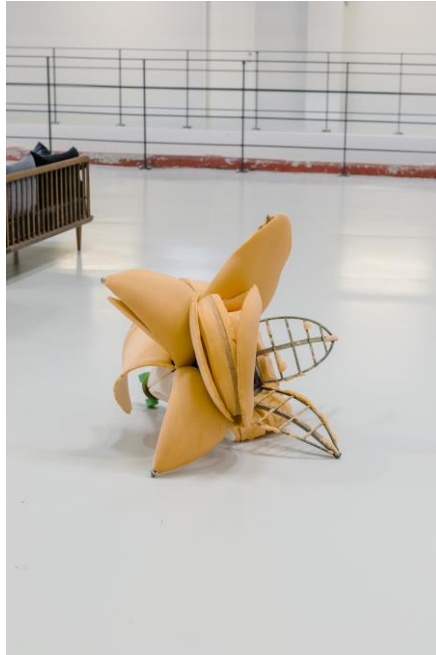
Bildet er av Nanna Abels skulptur «Ripe» fra 2018. (Foto: Masanori Umeda.)