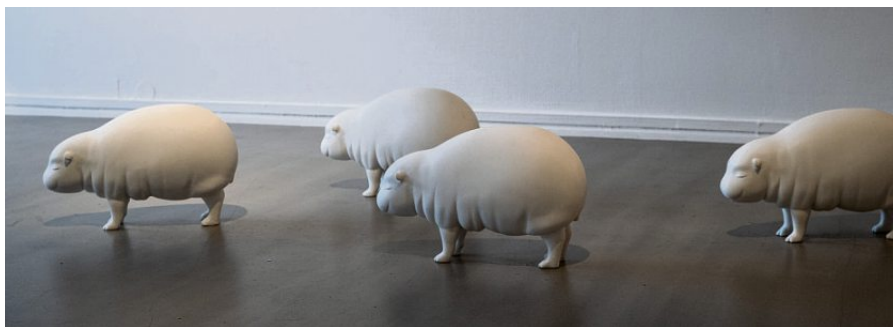
Utstillingen består av verk i både plastiske materialer og naturmaterialer.