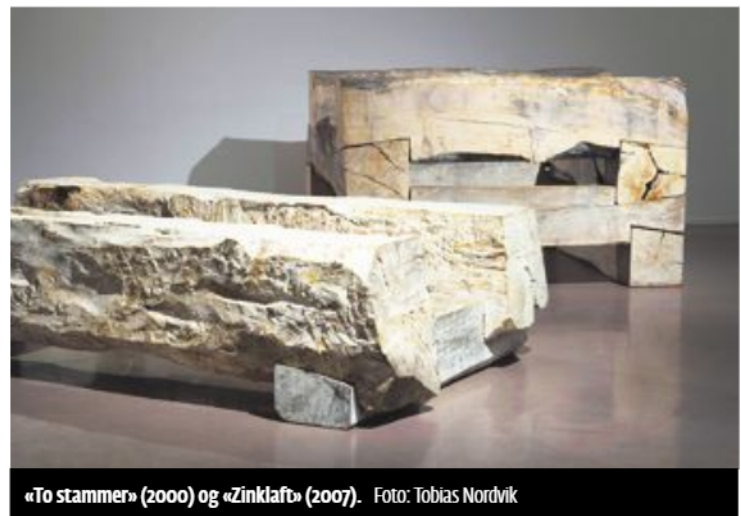
«To stammer» (2000) og «Zinklaft» (2007).