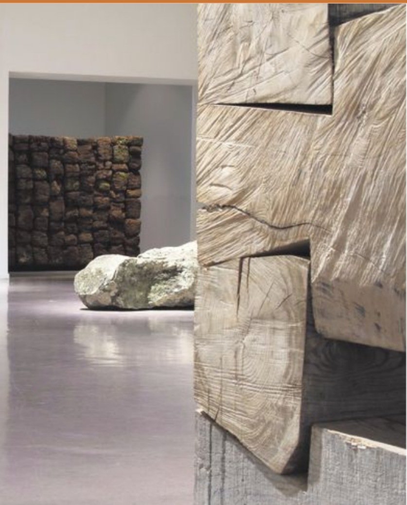
Wold stiller ut monumentale skulpturar i stein, tre og torv.

24. august–6. oktober Øksendal har fylt underetasjen i Kunstbanken med abstrakte fargeeksplosjonar. Målinga er påført overflata med synlege, bestemte penselstrøk. Fargane vrimlar i buktande spiralformer som syg oss inn i lerretet, samstundes som dei kraftige fargekontrastane kastar oss ut att.