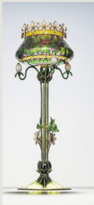
Hvitveisvasen (1901), privat samling.

30. august–29. september Lofoten internasjonale kunstfestival begynte med eit regionalt og nasjonalt nedslagsfelt i 1991 og har utvikla seg til ein internasjonal biennale. Festivalen har ikkje faste visingsstadar, men infiltrerer og utforskar det lokale landskapet. I år vert utstillingane viste i og kring Svolvær, og det overgripande temaet er tidevassona.